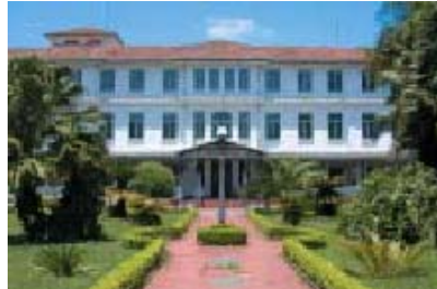
Figura 1 Sanatório Vicentina Aranha

“Em termos arquitetônicos é uma referência das primeiras manifestações da modernidade no Vale do Paraíba, sendo protegido como patrimônio histórico estadual pelo Conselho de Defesa do Patrimônio Histórico, Arqueológico, Artístico e Turístico – CONDEPHAAT”. 5 A infra-estrutura sanatorial passa a ser desativada nos anos de 1940. . 6