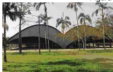
Figura 8 III