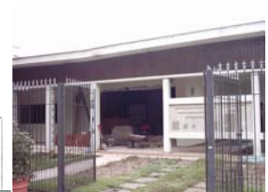
Figura 25 XII