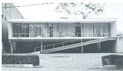
Figura 14 VIII

Na última década o Município da São José dos Campos passou por grandes transformações, acrescentando à característica de destacado centro industrial, a de centro regional de prestação de serviços. Como consequência viu alterada sua configuração urbana, tendo bairros antes residenciais transformados em sub-centros comerciais e de serviços. É real o fato de que inúmeras edificações foram descaracterizadas para se adaptarem a pequenos comércios e clínicas, quando não demolidas para a construção de prédios comerciais e residenciais.