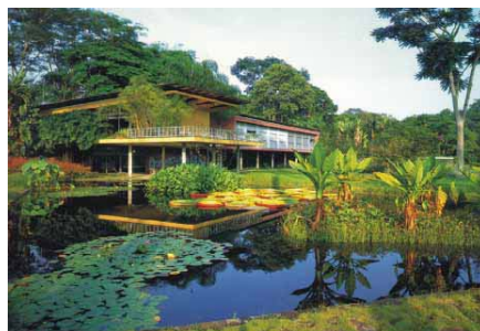
Figura 2- Paisagismo de Burle Marx para a área da residência Olivo Gomes.

Dois complexos arquitetônicos e paisagísticos marcam a evolução industrial e conseqüentemente a produção da Arquitetura Moderna da cidade. Da primeira fase industrial inicia-se a construção da área do Complexo Tecelagem Paraíba e Fazenda Santana do Rio Abaixo, hoje denominada “Parque da Cidade – Roberto Burle Marx.” Este elemento urbano é considerado patrimônio arquitetônico, ambiental e paisagístico. Além da história marcante para o desenvolvimento da primeira fase industrial da cidade e da qualidade das edificações e dos espaços contidos nesta área, é reconhecido também pela vasta área verde, além do fato de que todo seu potencial estar situado na cidade, compondo uma paisagem extremamente rica e bucólica, incrustada no meio urbano.