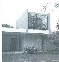
Figura 17 X