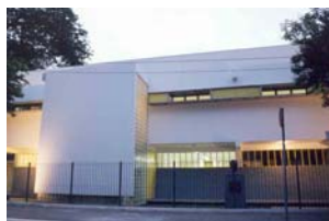
Figura 27 XIII