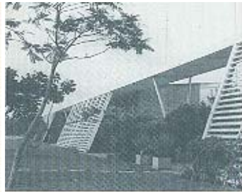
Figura 12 VI