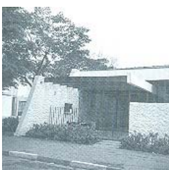
Figura 15 IX