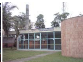
Figura 29 XIV

As diretrizes de atuação para a preservação da Arquitetura Moderna joseense só teriam propósito tendo-se a consciência de que são partes de um processo de revitalização e requalificação urbana, que necessitam da participação da comunidade, principalmente dos segmentos de maior poder econômico.