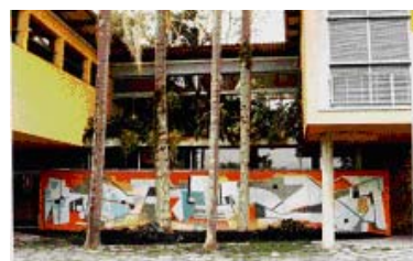
Figura 7 II