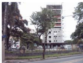
Figura 23 XI