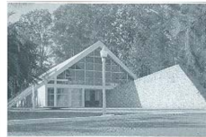
Figura 13 VII

O acervo arquitetônico que estava sendo construído com o projeto do Centro Tecnológico Aeronáutico, os projetos para a família Gomes, e a fundação de uma faculdade de Arquitetura 9 (que se diferenciava pelos métodos de ensino e conceituação teórica), trouxeram para a cidade muitos profissionais e estudantes de Arquitetura.