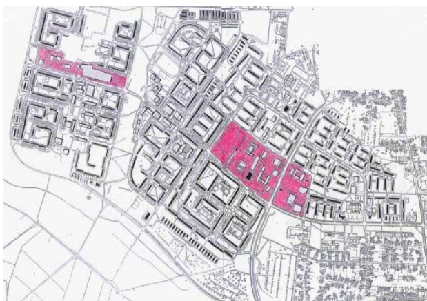
Centros comerciais de Wolfen Nord. Note-se a mudança no padrão de implantação dos edifícios, do paralelismo dos anos 60, à direita, para as estruturas que formam pátios internos dos anos 70 e 80.

Os edifícios têm problemas físicos decorrentes da técnica construtiva e materiais utilizados. Esses problemas já são bem conhecidos pelos profissionais alemães, estando as soluções mais adequadas bem equacionadas. O conjunto apresenta-se monótono e confuso, uma vez que os edifícios têm as mesmas características, não têm numeração, e a malha viária é mal distribuída e hierarquizada. O comércio local está concentrado no centro do conjunto, ainda apresentando oferta pouco diversificada. Os equipamentos comunitários (creches, escolas, clubes da juventude, etc.) estão em grande parte abandonados. O transporte coletivo foi considerado suficiente, havendo problemas para guarda de carros particulares.