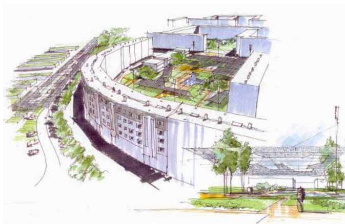
Perspectiva de pátio interno, vendo-se à esquerda área de garagens com telhados verdes. O uso de pérgulas e telas contribui para tornar menos opressiva a escala dos grandes blocos.

Foi proposta ainda a introdução de elevadores nos prédios, áreas destinadas a pequenos escritórios para autônomos e novas entradas, procurando criar referências e individualidade nos edifícios; alterações e criações de balcões, visando diminuir a monotonia das fachadas existentes; a utilização de novas cores e adornos nas fachadas e a criação de áreas externas cobertas por pérgulas, gerando uma melhor relação com as áreas verdes.