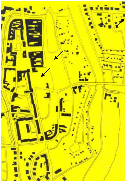
Figura e fundo. As setas assinalam os quarteirões trabalhados. Observem-se as densidades diferentes nas áreas limítrofes.

Observamos através da planta figura/ fundo que havia duas densidades diferentes nas áreas limítrofes a estes quarteirões vazios. Este espaço “perdido” funcionava como se dividisse o core em duas partes. Decidimos romper este limite imaginário entre edificações modernas e antigas com uma nova estrutura.