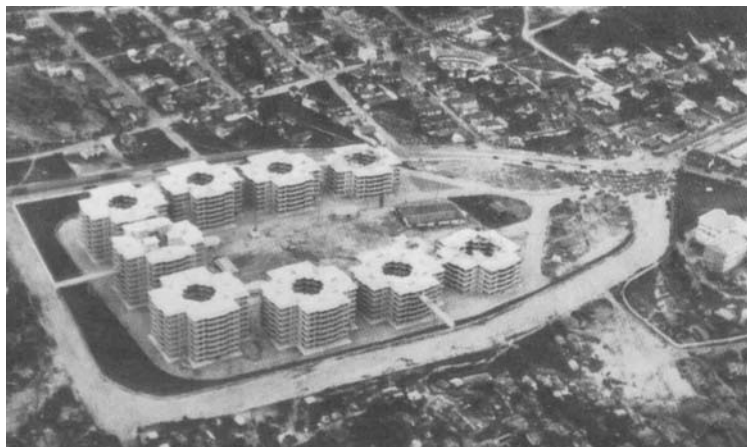
Vista aérea Conj. Residencial da Lagoinha – Belo Horizonte

O Conjunto Residencial da Lagoinha não atingiu seus objetivos na íntegra e tão pouco abrigou os moradores da Favela Pedreira Prado Lopes, até mesmo porque não era objetivo dos IAPs construir habitação para não contribuintes. Porém, vale ressaltar as inovações arquitetônicas, urbanísticas e sociais que este conjunto implantou na cidade de Belo Horizonte.